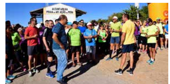
Atividades desportivas, como a marcha-corrída