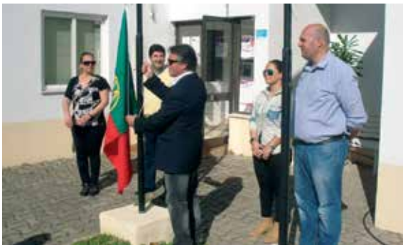
Nas comemorações do 25 de abril