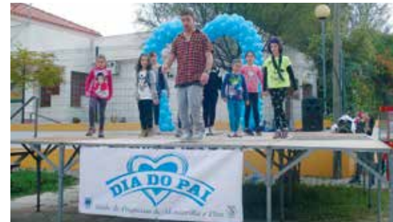
Comemorações do Dia do Pai