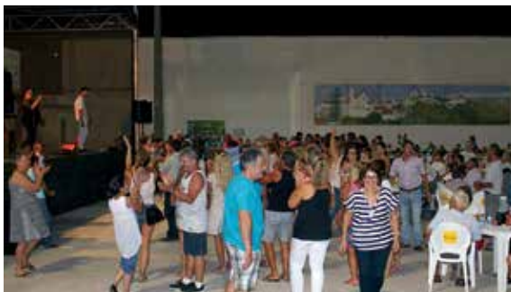
O Arraial do Petisco, em Pêra