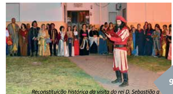
Reconstituição histórica da visita do rei D. Sebastião a Alcantarilha e Mercado Quinhentista