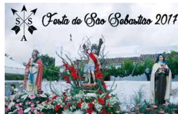
Festa anual dedicada a S. Sebastião