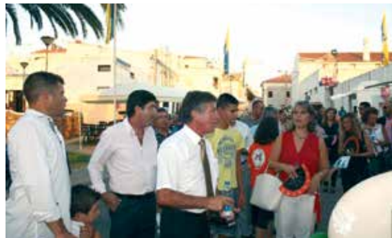
Feira de Frutos Secos