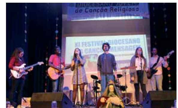
Festival Jovem da Canção Religiosa, em Pêra