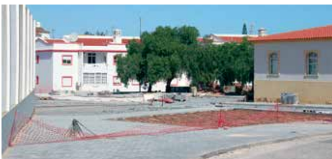
Parque de Feiras e Mercados de Alcantarilha

Foi também solicitada a pavimentação do Caminho das Centieiras a Vale de Margem; Estevais de