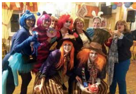
O Carnaval festejado em Alcantarilha