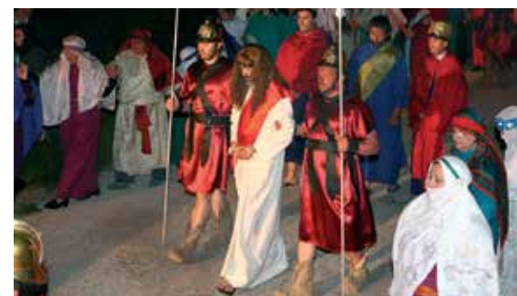
A encenação da Paixão de Cristo, em Pêra