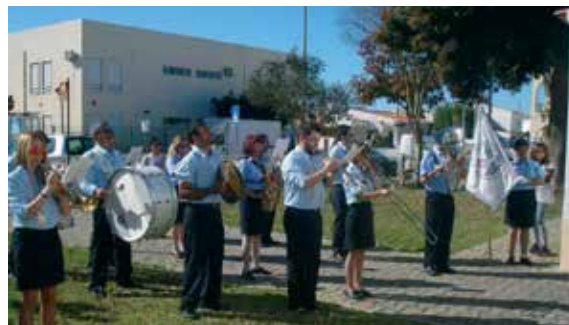
A Banda da Sociedade Filarmónica de Alcantarilha, uma presença constante nas festividades