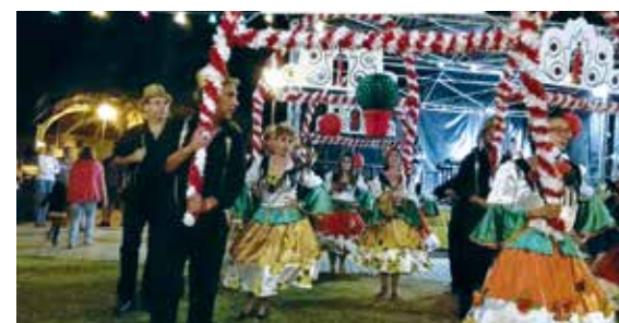
Marchas populares em Alcantarilha