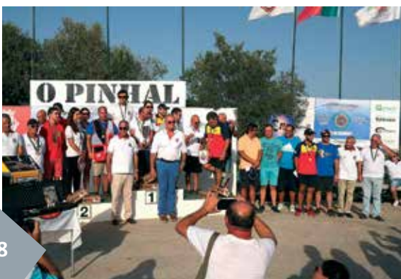
Campeonato do Mundo TRAP 5, em 2016, no Campo de Tiro O Pinhal