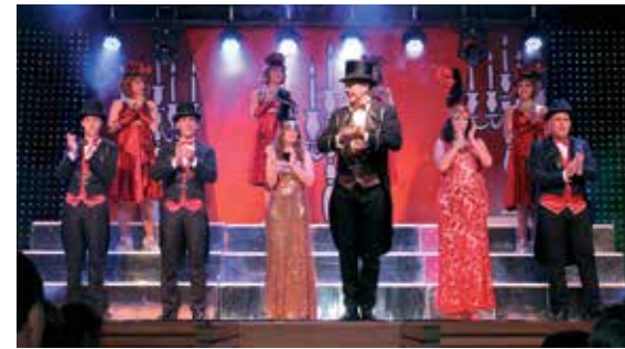
Teatro de Revista, no Centro Pastoral de Pêra