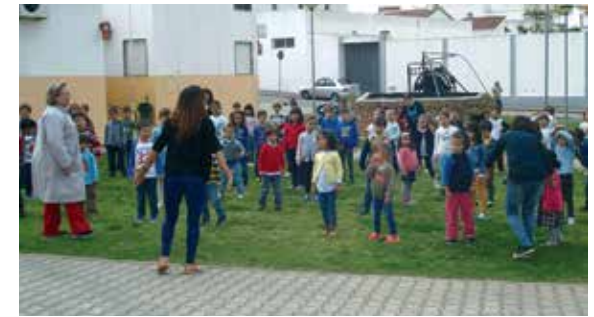
Atividades para crianças