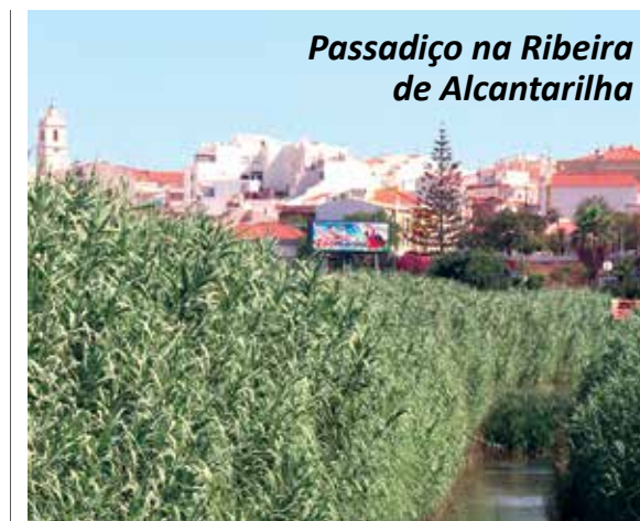
Passadiço na Ribeira de Alcantarilha

Três quilómetros de passadiço ao longo da Ribeira de Alcantarilha, fazendo a ligação entre as freguesias de Alcantarilha, Pêra e Armação de Pêra, é o grande projeto que este executivo preparou e sonha ver concretizado.