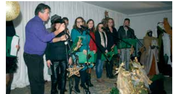
Cumpr-se ainda a tradição das Janeiras