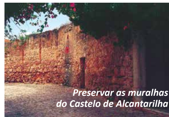
Preservar as muralhas do Castelo de Alcantarilha

Das muitas pretensões que temos para o futuro das nossas freguesias, apostamos na preservação do nosso património, na promoção da cultura e em projetos que possam fazer a diferença.